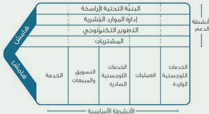
نموذج سلسلة القيمة - بورتر